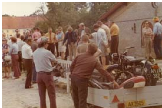
Der blev også handlet med dele som medlemmerne selv havde med. Mange effekter har i årenes løb skiftet ejermand på Egeskov.